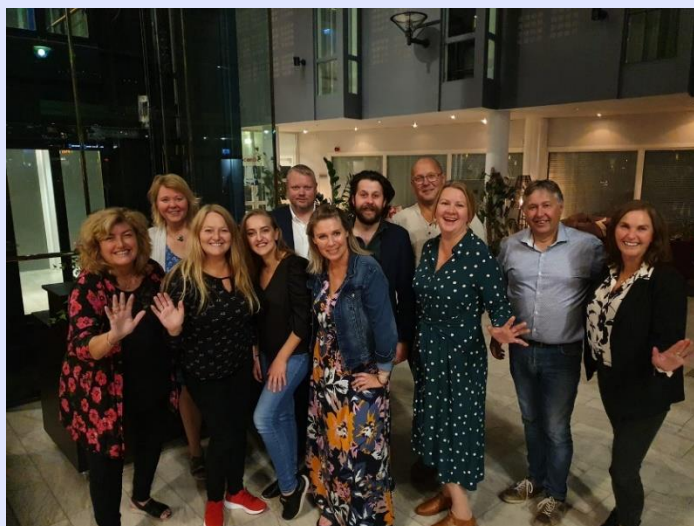
Styret og ansatte på strategisamling høsten 2020