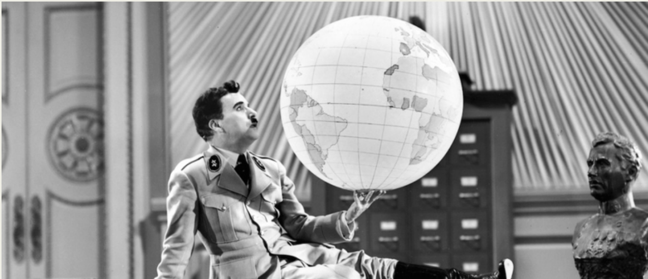
LATTERLIG: Charlie Chaplin demonstrerte den politiske humorens sprengkraft i "Diktatoren" fra 1940