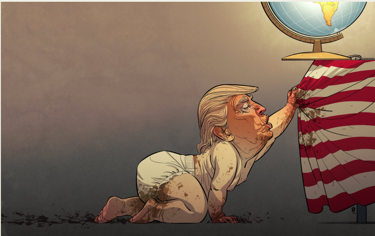
POLITISK SATIRE er "great again!" (Bloom)

Å bevege seg utover rammene var bokstavelig talt en hodeløs handling. Hvis ikke fyrsten moret seg, hadde også narrens fremtid dårlige odds.