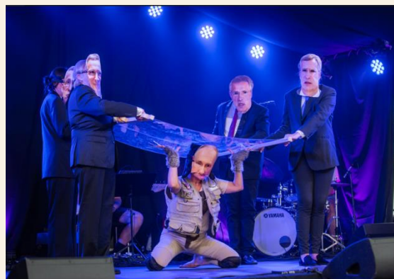
Voksne Talenter vant prisen i temakonkurransen «Humor mot diktatoren»